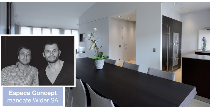
Espace Concept mandate Wider SA

En transformant intégralement un vieil appartement genevois en un logement ouvert et contemporain, le bureau d'architecture d'intérieur Espace Concept signe avec adresse, un relooking de premier ordre aux détails de constructions et de décorations réfléchis.