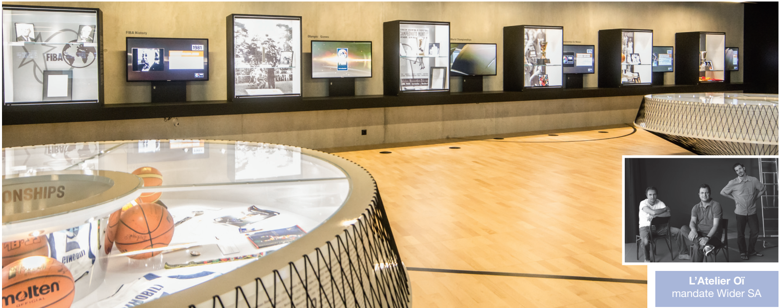
L'Atelier Oï mandate Wider SA

We are basketball! C'est par ces mots que la FIBA accueille ses visiteurs dans son nouveau siège de Genève.