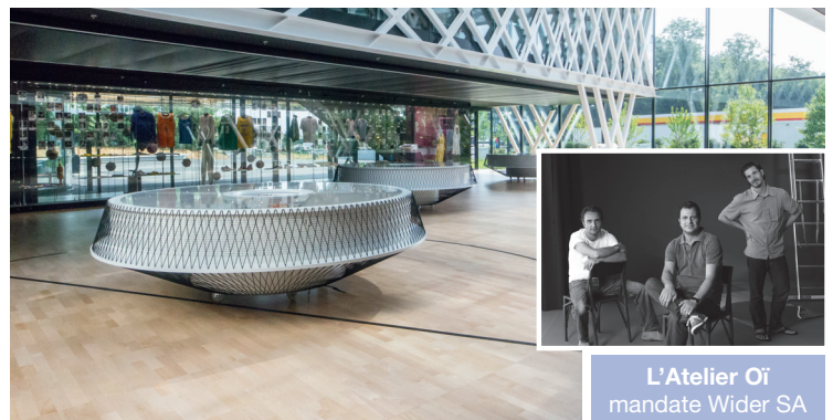
L'Atelier Oï mandate Wider SA

We are basketball! C'est par ces mots que la FIBA accueille ses visiteurs dans son nouveau siège de Genève. Véritable clin d'oeil au ballon rond utilisé de par le monde, la décoration se décline dans un univers qui se veut ludique et contemporain.