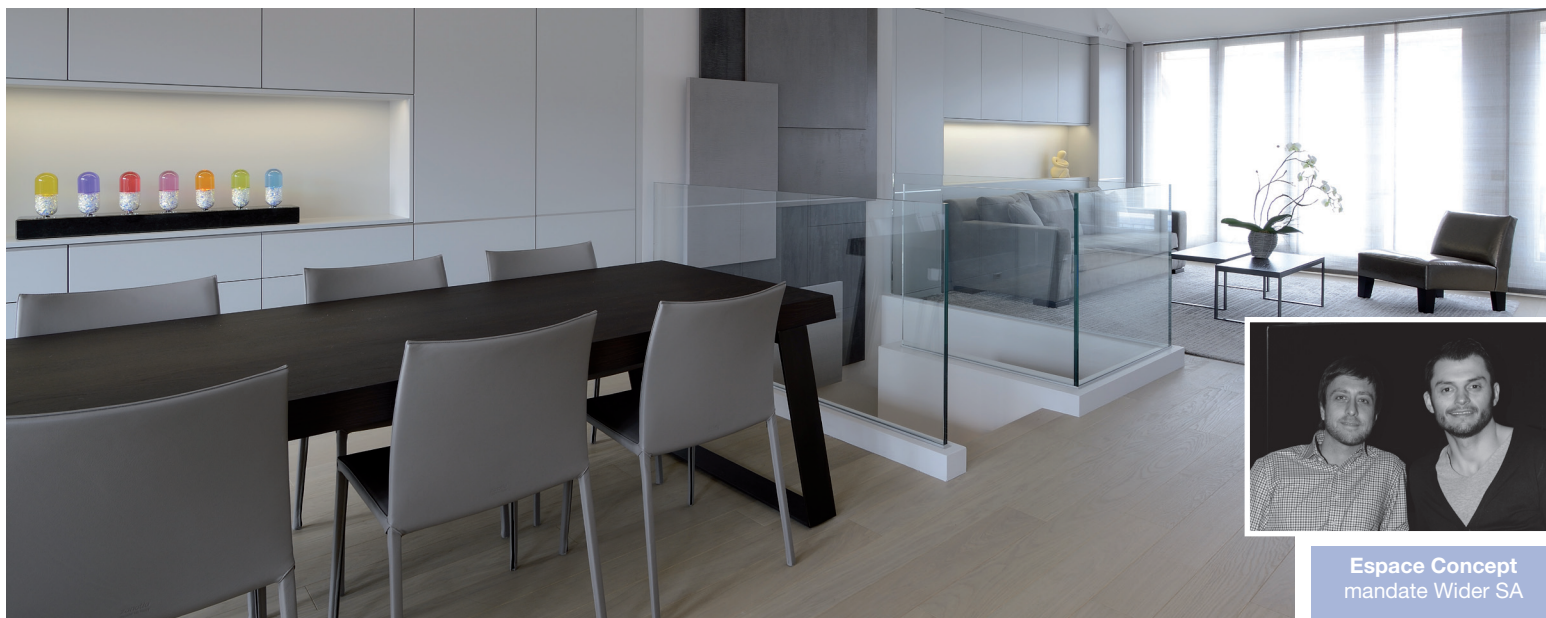
Espace Concept mandate Wider SA

Les attentes des propriétaires de cet appartement situé dans un immeuble genevois du début du siècle étaient claires. Ils souhaitaient transformer leur bien en un objet design actuel et au confort sophistiqué.